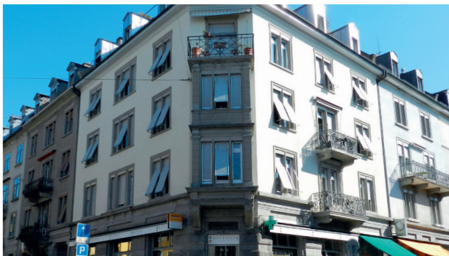
Zürich, Freiestrasse Wohn- und Geschäftshaus, Sanierung Fassade und Lukarnen

Mit Leidenschaft unterstützen wir Sie vom Badezimmerumbau bis zur energetischen Gebäudehüllensanierung. Ob Mehr- oder Einfamilienhaus, Bürogebäude oder Hotel – wir helfen, die Renovationsvorhaben unserer Kunden zielgerichtet zu realisieren. Weitere Referenzen zeigen wir Ihnen gerne auf Anfrage.