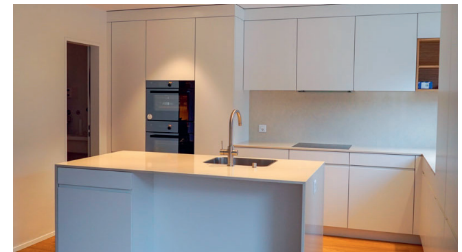
Küsnacht, Hesligenstrasse EFH, komplette Innensanierung mit Fassade