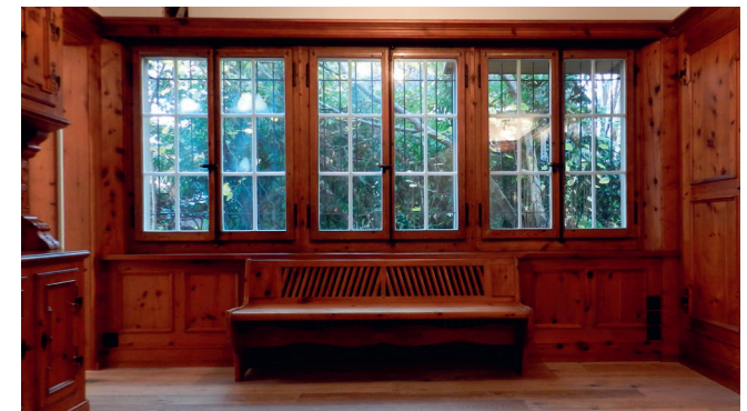
Zürich, Rossbergstrasse EFH, Innensanierung