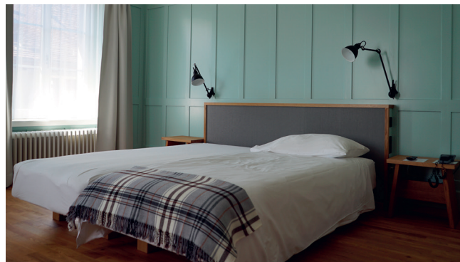
Rapperswil, Hauptplatz Hotel, Sanierung Hotelzimmer