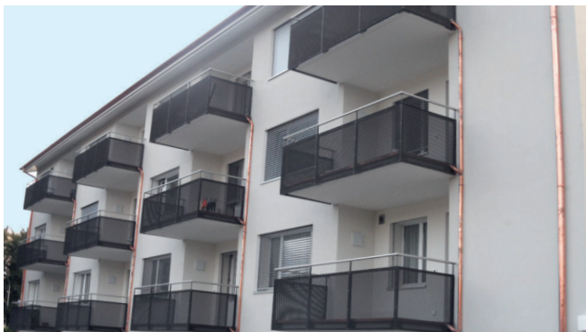
Feldmeilen, General-Wille-Strasse MFH, Energetische Fassadensanierung mit Balkonerweiterung